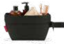
Kulturbeutel „Foldcase Black“, von reisenthel