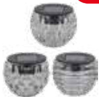
Tischleuchte Solar, 8x8x6cm, verschiedene Varianten