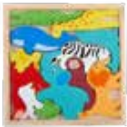
Holzpuzzle „Animal“, 12 tlg.