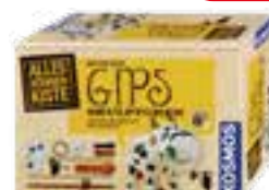
Bastelbox Gips-Skulptur, von Kosmos