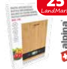
Küchenwaage in Bambusoptik, bis 5kg, von alpina