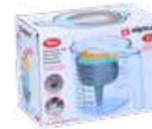
Messbecher-Set mit Messlöffeln, 1Liter, von alpina