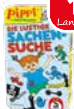
Mitbringspiel Die lustige Sachensuche - Pipi Langstrumpf