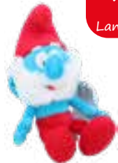
Plüschfigur „Papa Schlupf“, 25cm