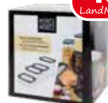
Vorratsdosen-Set mit Deckel 4 tlg., 400ml, 2x900ml, 1400ml