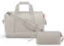
Travel-Set, 2tlg., in Herringbone Sand, von reishel