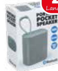
Bluetooth-Lautsprecher, mit integriertem Radio, 3Watt