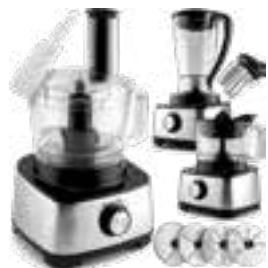
Küchenmaschine, 1200W, 3in1