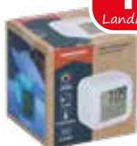
Wecker digital mit Farbwechsel, 8x8x8cm, batteriebetrieben, von Grundig