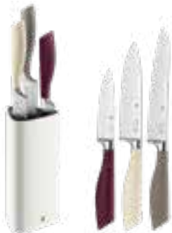
Messerblock 'Elements', 4tlg., von WMF