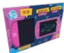
Zeichentablett für Kinder, 25x14x4cm