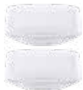
Servierschüssel-Set 2 tlg., aus Glas, Ø11cm