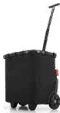
Carrycruiser, Frame Black, von reishel

Jahresprämien sind gültig bis zum 31.12.2026