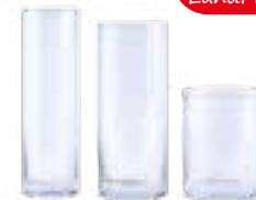
Vasen-Set, 3-tlg., 27x8cm, 25x10cm, 15x12cm