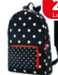
Rucksack „Mini Maxi“ in Mixed Dots, von reisenthel