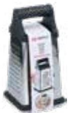
Reibe mit Auffangbehälter, 300ml, 10,7x22cm, von alpina