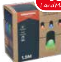
LED-Partybeleuchtung farbig, 4 Lampen, 1,5m, USB-betrieben, von Grundig