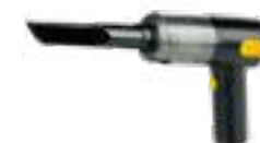
Auto-Staubsauger, akkubetrieben, 40Watt, von Dunlop